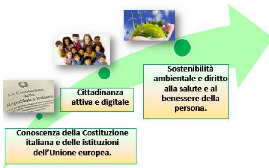
Nuclei concettuali dell'insegnamento dell'ed. civica

secondo ciclo di istruzione, per un orario complessivo annuale che non può essere inferiore alle 33 ore , da individuare all'interno del monte orario obbligatorio previsto dagli ordinamenti vigenti e da affidare ai docenti del Consiglio di classe/interclasse o dell'organico dell'autonomia